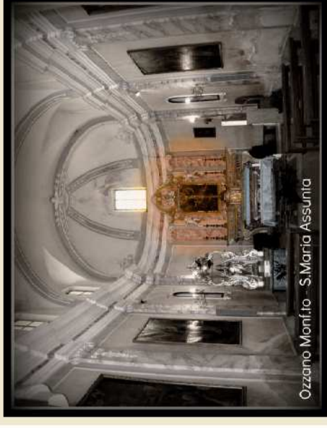
Ozzano Monf.to - S.Maria Assunta