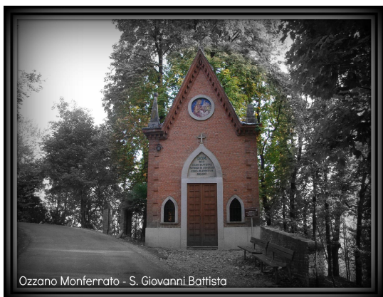
Ozzano Monferrato - S. Giovanni Battista