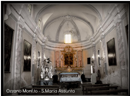
Ozzano Monf.to - S.Maria Assunta